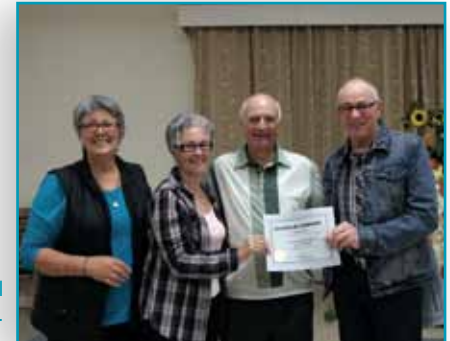
Activité d'accueil des nouveaux arrivants.

De nombreuses suggestions ont été faites par les répondants pour améliorer leur cadre de vie, attirer de nouvelles familles ou pour maintenir actifs les aînés de la communauté.